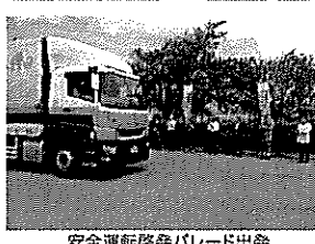
安全運転啓発パレード出発